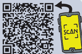
PRAKTIJKVOORBEELD LOB IN HET LEERBEDRIJF