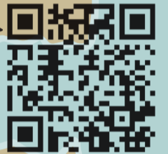
VIDEO LOB IN DE BBL